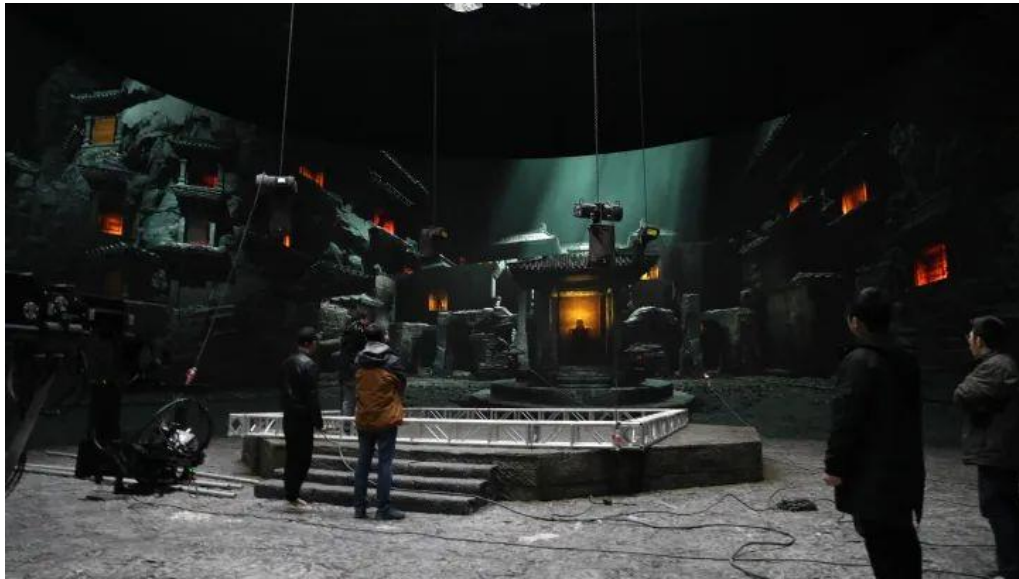
图：爱奇艺横店虚拟制作摄影棚《云之羽》拍摄现场